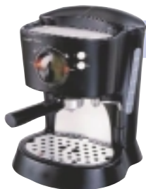
Ekspres do kawy

Podstawowe wyposażenie każdego warsztatu.