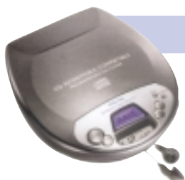
Przenośny odtwarzacz CD

Przenośny radiomagnetofon z odtwarzaczem płyt CD. Praktyczny w domu i na wycieczce