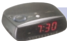
Zegarek z budzikiem